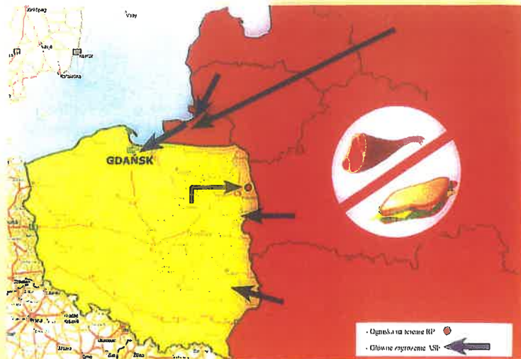
Schemat nr 1.

Mimo, iż wirus ASF nie jest groźny dla człowieka, region w którym zostanie stwierdzona choroba narażony jest na poważne straty ekonomiczne związane z ograniczeniami w obrocie żywymi świniami, ale przede wszystkim z ograniczeniami w handlu i obrocie wieprzowiną, oraz wszystkimi środkami spożywczymi zawierającymi wieprzowinę. Region występowania ASF narażony jest także na poważne ograniczenia w ruchu osobowym i samochodowym.